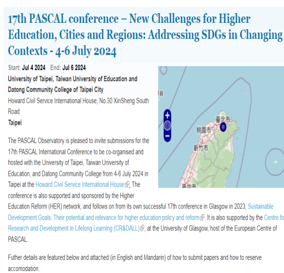
圖 2-4 PASCAL 會議海外報名資訊內容