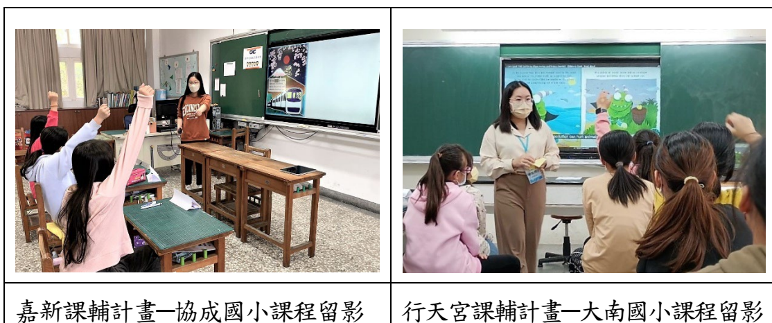
嘉新課輔計畫—協成國小課程留影