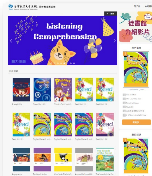
圖 2-5 本系統英語教育電子圖書館入口網

本系統英語教育電子圖書館，於 111 年由香港鉅理教育科技有限公司無償提供並協助建置，藏書內容包含英語學習、測驗以及兒童繪本等約有 250 餘冊，本系統負責帳號新增與管理，並提供予系統學校在輔導偏鄉學童英語教學時使用，本系統英語教育電子圖書館網址： https://tue.ebook.hyread.com.tw/index.jsp ，網站入口請見下圖 2-5。