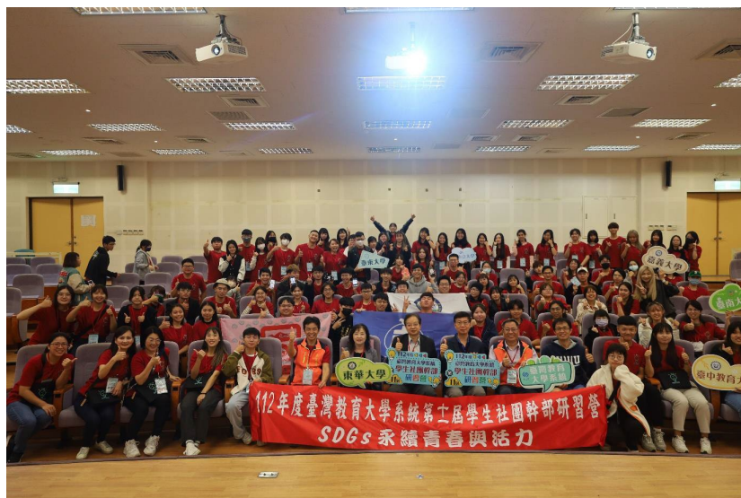
圖 2-2 臺灣教育大學系統第十一屆學生社團幹部研習營-開幕大合照

依 111 年 9 月 27 日第六屆第二次系統委員會議決議，112 年度 11 月 25 日至 26 日之「112 年度臺灣教育大學系統第 11 屆學生社團幹部研習營潛能探索~發現最好的自己」由國立東華大學主辦。本次參加對象為本系統七所大學之學生社團幹部(含全校自治性社團及一般社團)及師長，共計 125 名參與，活動當天本系統丁一顧執行長擔任開幕式致詞嘉賓，與國立東華大學趙涵捷校長共同歡迎各系統學校師生參與，開幕大合照如下圖 2-2。