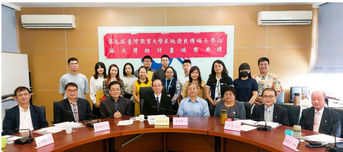
圖 2-1 臺灣教育大學系統第九屆優良博碩士學位論文獎助計畫得獎者大合照

112 年度「第九屆優良博碩士學位論文獎助計畫」於 112 年 3 月開放申請，並於 112 年 4 月至 6 月依據論文類別邀請專家學者審查。本次報名組別共有「教育類博士」及「教育類碩士」、「文理類博士」、「文理類碩士」及「藝術及其他類碩士」五類，報名學生 87 人，榮獲優良獎或佳作之得獎者共計 21 人，審查過程中動員 249 位大學教授擔任評審委員，頒獎典禮業於 112 年 10 月 23 日第六屆第四次系統委員會議前舉行，委員及得獎者合影如下圖 2-1。