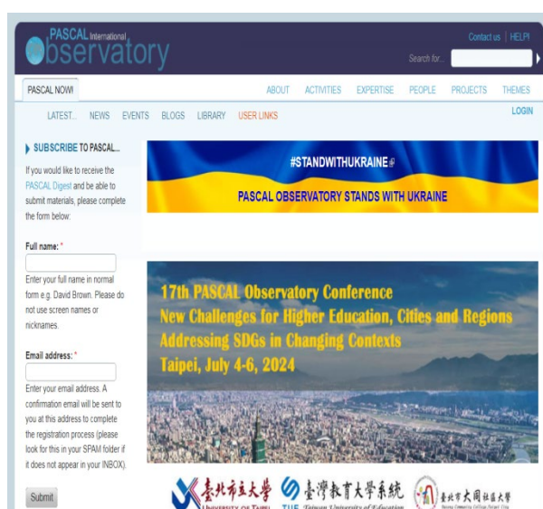
圖 2-3 PASCAL 國際觀察中心網站首頁

經費部分，海外代表參加本次會議須收取報名費，僅提供部分貴賓機票及落地接待。本活動資訊已公告於 PASCAL 國際觀察中心網站 ( https://pascalobservatory.org/pascalnow )，如下圖 2-3 及 2-4。112 年 11 月臺北市立大學向觀光傳播局提出 113 年第 1 期「臺北市國際會議、展覽及獎勵旅遊贊助」計畫，並於 113 年 1 月獲得補助經費新臺幣 18 萬 2,000 元，以及參觀臺北 101 的門票。本系統亦於 113 年系統運作經費中編列活動費。本案系統撥款之額度將配合臺北市立大學自籌款、海外代表報名費用及對外申請補助款等收入確認後，再行提撥活動經費。